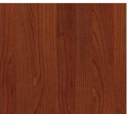
Paglia di Vienna